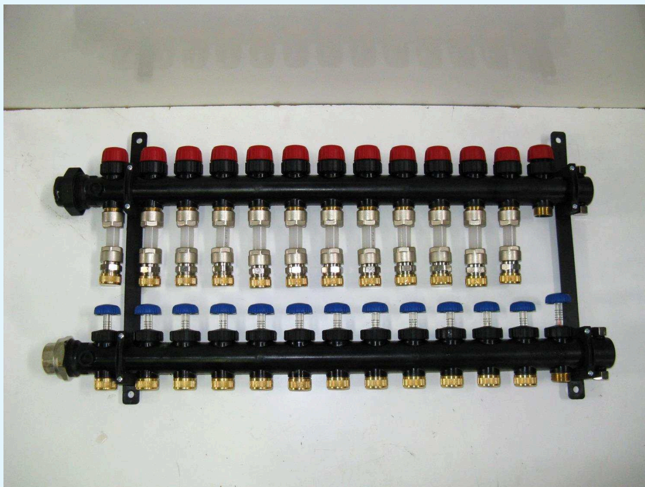
Fotografia del campione.